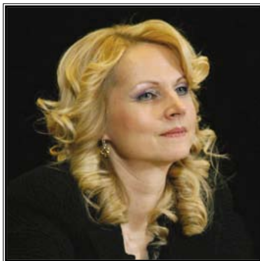
МИНИСТР ЗДРАВООХРАНЕНИЯ И СОЦИАЛЬНОГО РАЗВИТИЯ РОССИЙСКОЙ ФЕДЕРАЦИИ Татьяна Алексеевна Голикова

Социальное развитие в России на данный момент зависит от решения проблем в пяти основных социальных областях: